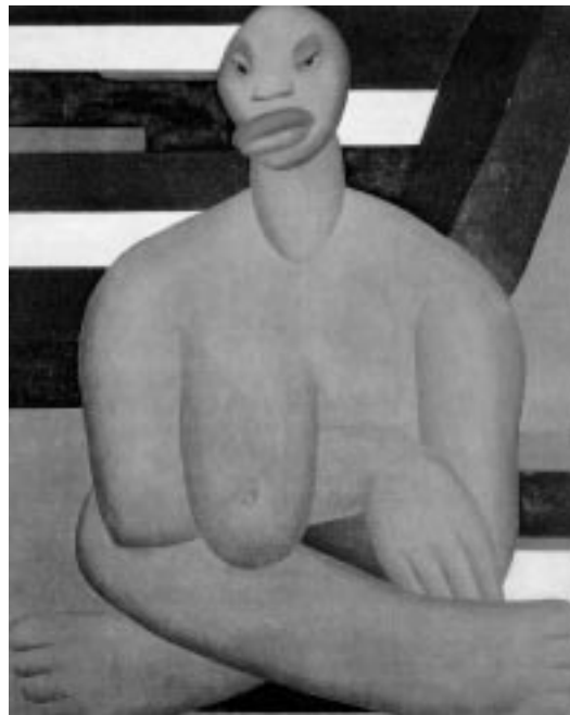
Figura 4: Tarsila do Amaral, "A Negra", 1923, Museu de Arte Contemporânea MAC/USP, SP.

Cada obra de arte é, ao mesmo tempo, produto cultural de uma determinada época e criação singular da imaginação humana, cujo sentido é construído pelos indivíduos a partir de sua experiência.